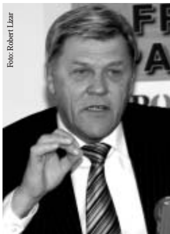
Themessl: Beim Pfuscher läßt die Koalition Millionen an Sozialabgaben links liegen.

Sinnvoller wäre, wie Kdolsky selbst schon vorgeschlagen habe, eine Aufstockung der niedergelassenen Fachärzte sowie eine Aufwertung der Hausärzte, forderte Belakowitsch-Jenewein: „Unser Gesundheitssystem, das gerade wieder als eines der Besten der Welt ausgezeichnet wurde, darf nicht einer Laune der Ministerin zum Opfer fallen.“