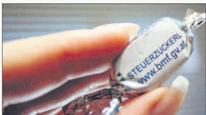
Wer bezahlt alle „Zuckerle“?

ausschauenden Politiker, diesen Unfug sofort zu stoppen und ein Moratorium zu beschließen, demzufolge so kurz vor der Wahl keine zusätzlichen Schulden mehr gemacht