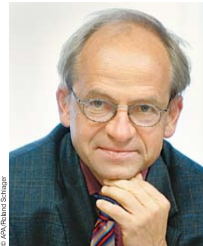
Wifo-Chef Aiginger: „Nachfragestimulus ist wegen schlechter Konjunktur nötig.“

Als Hauptaufgabe für die nächste Regierung ortet er einen genauen Kassasturz – um zu sehen, wie viel Geld nach den „Wahlzuckerln“ von letzter Woche überhaupt da sei. Danach gelte es, die Steuerreform 2010 zu definieren. Kleine Teile dieser Reform sollten dabei auf 2009 vorgezogen werden: „Wenn man für 2010 eine Entlastung plant, dann muss auch das nachfragewirksame Paket, das man bereits für 2009 schnüren sollte, ein Teil der Reform sein“, so Aiginger abschließend.