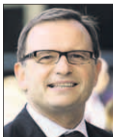
Karlheinz Kopf hat Vorbehalte gegen Schwarz-Blau-Orange.