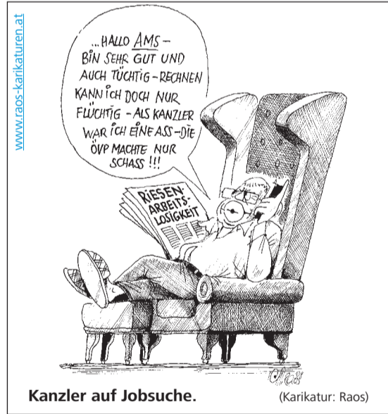
Kanzler auf Jobsuche.

Petzner war nach dem Tod des Kärntner Landeshauptmannes Jörg Haider als designierter Partei- und Klubchef eingesetzt worden. Er zog sich in der Folge allerdings in äußerst emotionalen Medienauftritten, in denen er ausführlich über seine private Beziehung zu Haider sprach, parteiinternen Unmut zu. Dass er wegen seiner umstrittenen Medienauftritte abgelöst wurde, dementierte Petzner freilich: „Ich wurde nicht abmontiert.“