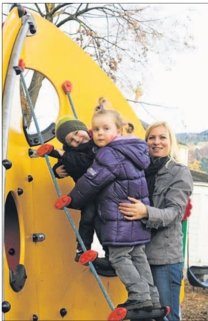
Zur Familienentlastung müssen noch Details geklärt werden: Pro Kind und Jahr winken aber bis zu 1400 Euro.

Das Gesamtpaket ist im Idealfall spürbar: Wer alle Maßnahmen ausschöpfen kann, darf mit einer jährlichen Entlastung von rund 1400 Euro rechnen.