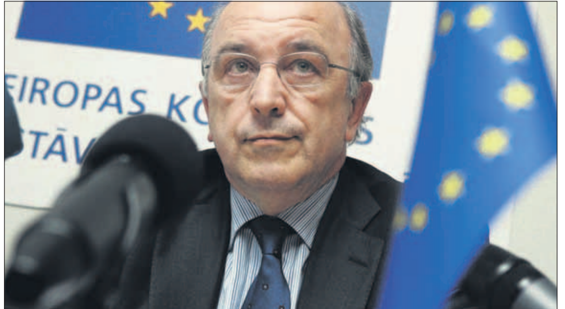
EU-Währungskommissar Joaquin Almunia vermisst einen österreichischen Plan zur Budgetsanierung nach der Wirtschaftskrise.

Verfahren laufen derzeit gegen so gut wie alle großen EU-Länder, von Großbritannien über Spanien bis Frankreich. Finanzminister Josef Pröll