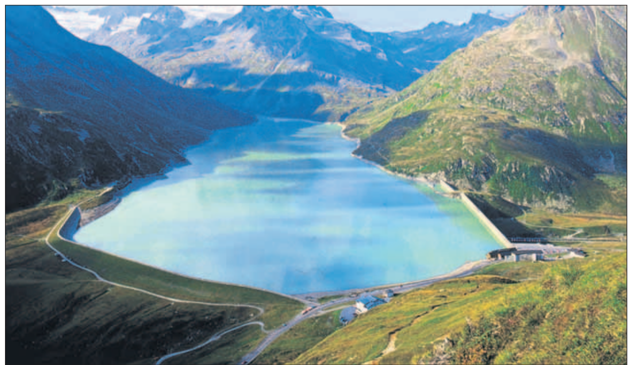
Der Silvrettastausee – Zwei Drittel des heimischen Stroms werden in Wasserkraftwerken erzeugt.

Die Investitionsoffensive der E-Wirtschaft sollte möglichst rasch umgesetzt werden. Dafür